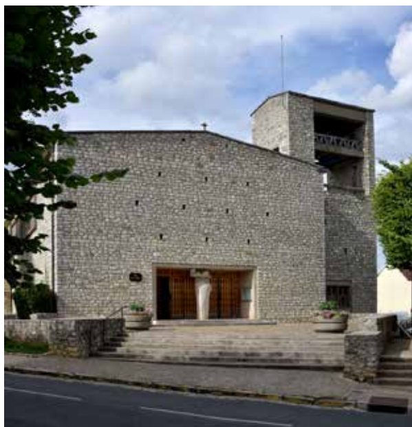
Église Saint-Denis à Tournan-en-Brie