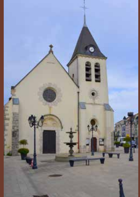
Église Saint-Pierre à Ozoir-la-Ferrière