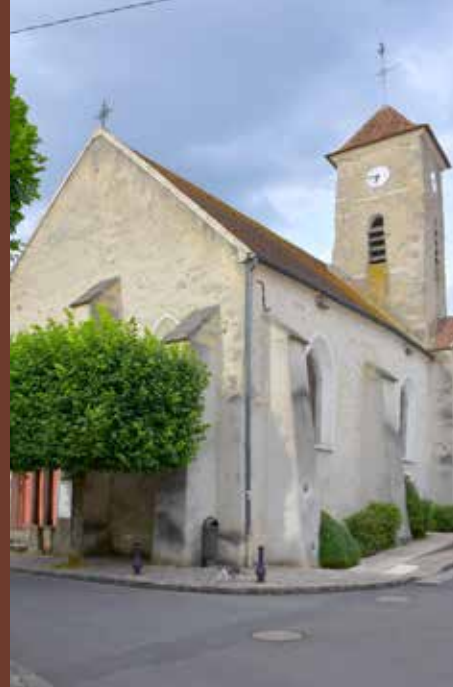
Église Saint-Germain à Roissy-en-Brie