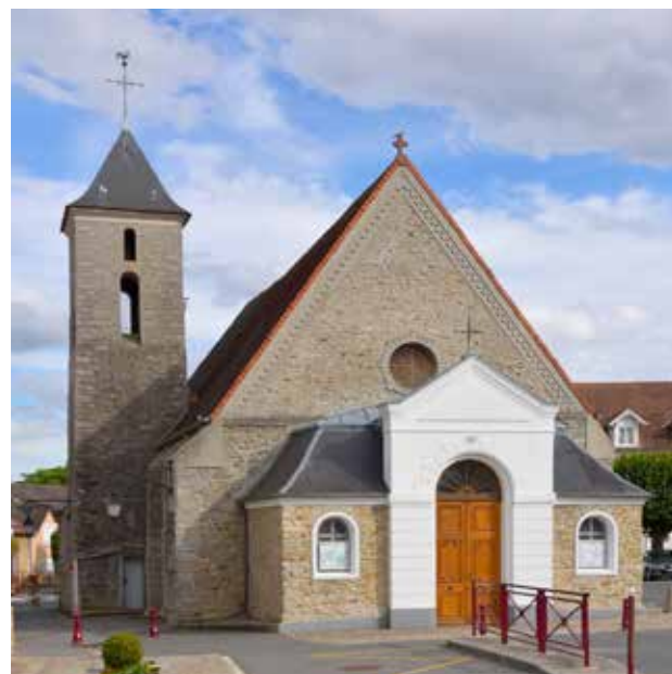
Église Saint-Jean-Baptiste à Gretz