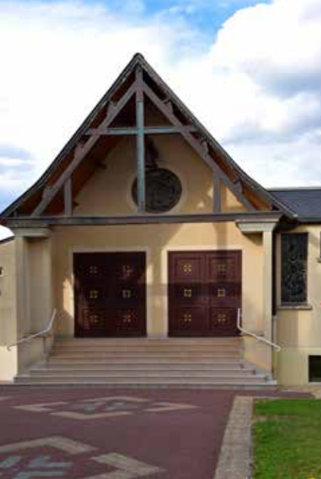
Église des Pèlerins d'Emmaüs à Pontault-Combault