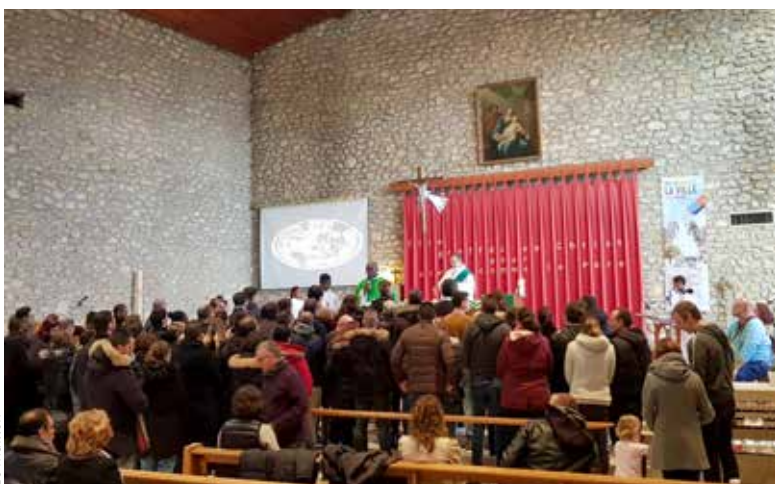
Les fiancés sont accueillis lors d'une messe dominicale qui leur est consacrée.

L'équipe de préparation au mariage du pôle