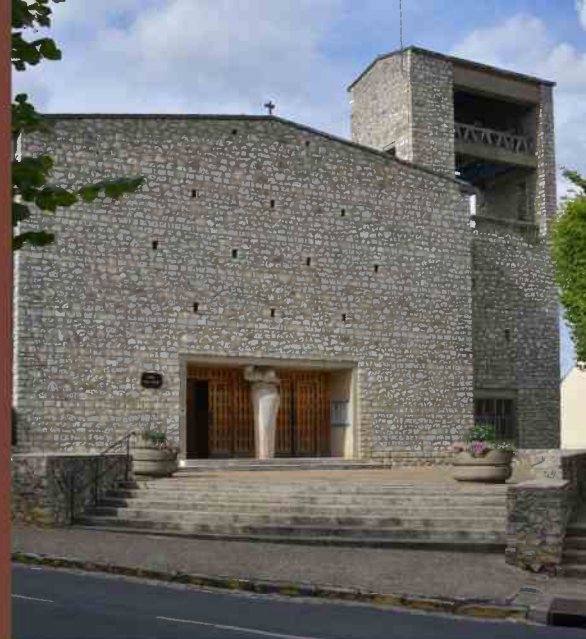
église Saint-Denis à Tournan-en-Brie