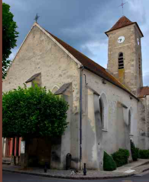
église Saint-Germain de Roissy-en-Brie