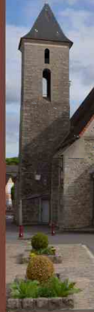
église Saint-Germain de Pontcarré