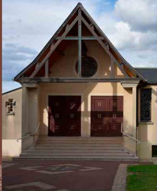
église des Pèlerins d'Emmaüs à Pontault-Combault