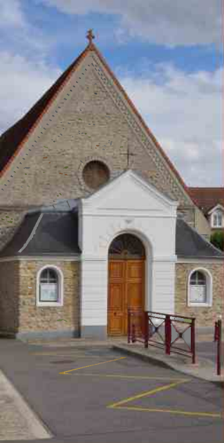
t-Jean-Baptiste à Gretz