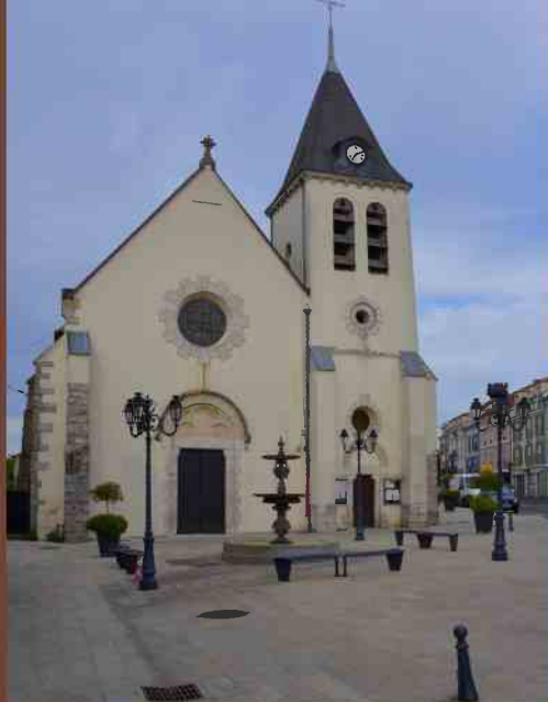
église Saint-Pierre à Ozoir-la-Ferrière